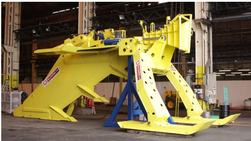
Figuur 3 Sea Stallion Ploeg van Royal IHC

Een gestuurde boring wordt gebruikt om de kabels onder het strand en de zeewering te geleiden. Er hoeft geen geul gegraven te worden die inbreuk maakt op de zeewering. Kabels zijn massief en de grond zet zich om de kabel, waardoor geen problemen met het wegspoelen van zand en klei onder de zeewering en het strand te valt te verwachten. De impact boven de grond is beperkt tot de werkzaamheden bij de gestuurde boring. Wordt van achter de zeewering richting de zee geboord en daar gelast op het zee segment.